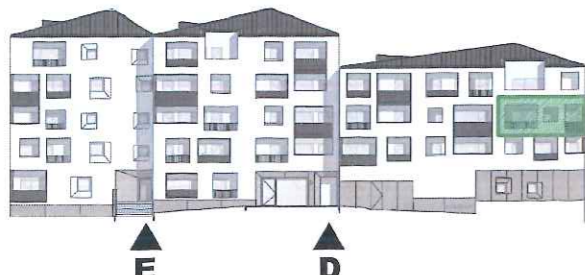
Élévation sud Bâtiment 2